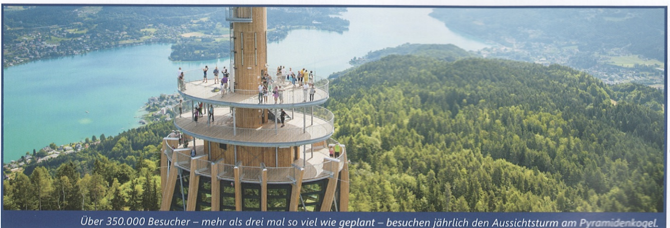
Über 350.000 Besucher – mehr als drei mal so viel wie geplant – besuchen jährlich den Aussichtsturm am Pyramidenkogel. ▶

Innovation, Kreativität und Anstrengung, die dabei hilft, die Projektziele schneller und besser zu erreichen, werden belohnt. Wie unser Körper Glückshormone ausschüttet, wenn etwas gut gelingt, so sollen auch die Beteiligten am Erfolg teilhaben können.